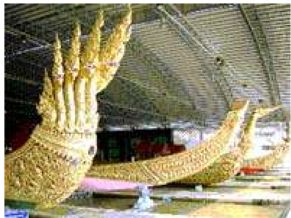
Perspectiva de dues vistes de l'espai on hi han les falues

La proximitat de l'edifici de les embarcacions reials amb el Wat Aran (antic palau reial) no és casualitat. Fins fa poc, el rei assistia al temple de l' Alba amb la seva barca adornada amb excés, per portar noves túniques per els bonzes amb ocasió de les festes de Thopt Kathin , que marca el final de la quaresma budista. En el museu és possible admirar la sumptuosa embarcació la Suphannahongse emprada per aquelles ocasions, de 45 metres d'eslora i que es distingeix de les demés per un cap de signe esculpit i decorat a la proa i una cua de serp a la popa. Fou construïda durant el regnat del Rama I.