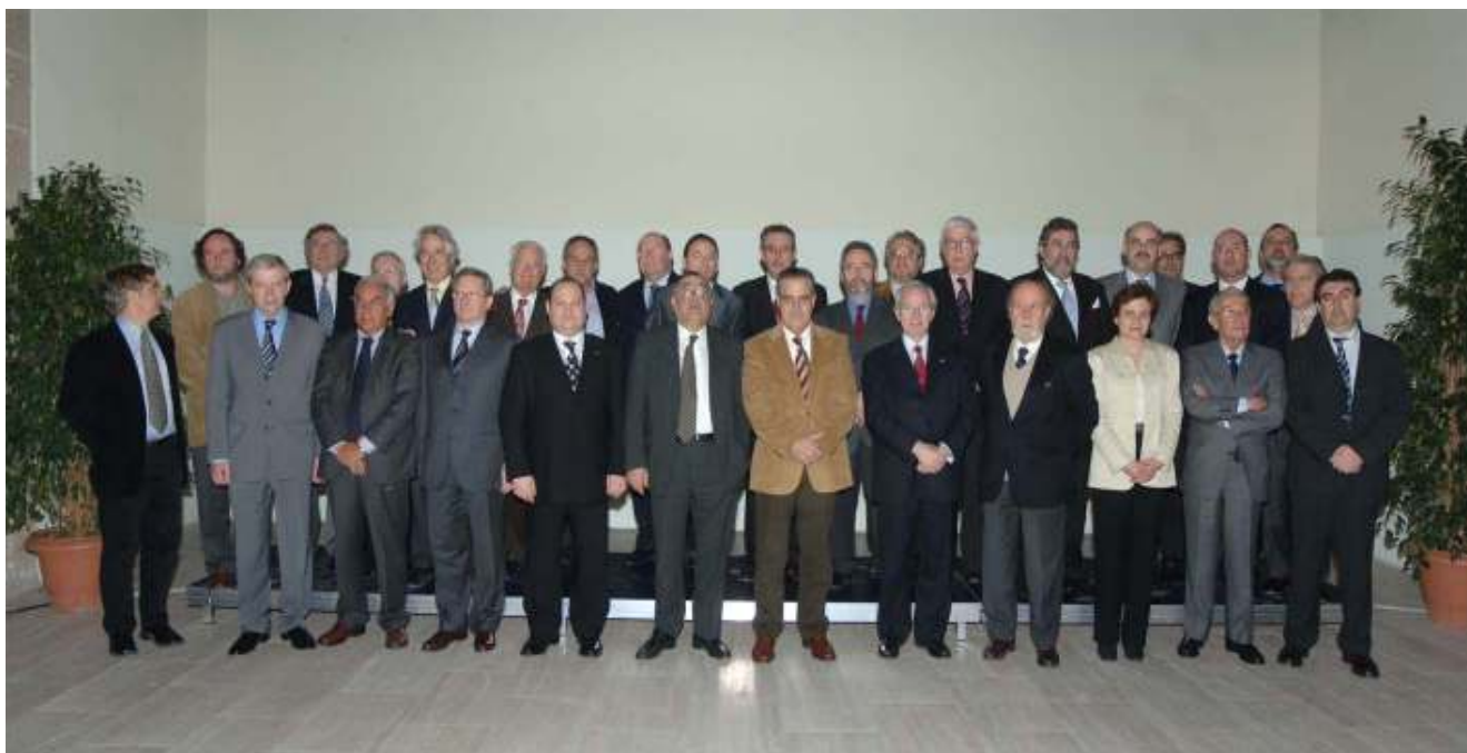
Fotografia dels patrons fundadors de l'esmentada Fundació

Acabà l'esdeveniment amb un aperitiu al qual assistiren tots els implicats a l'acte i demés invitats.