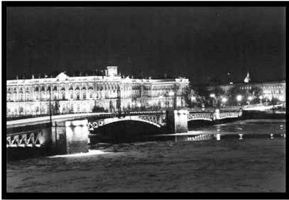
Vista nocturna d'uns dels ponts de Sant Petesburg

La conferència començà a les 19 h. i acabà després d'un petit col·loqui a les 20 h. amb un nombre regular d'assistents.