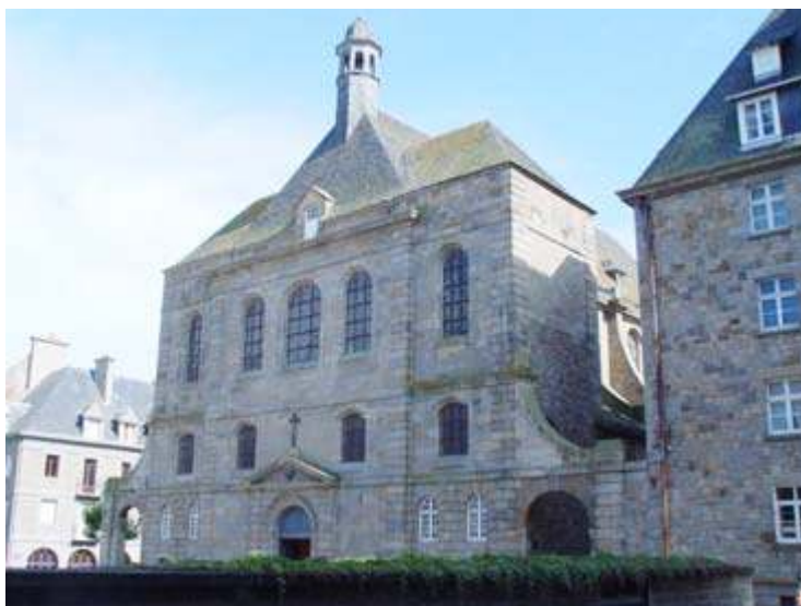
Seu de l'exposició a Saint-Malo

La revista SIRGA no es fa responsable de les opinions i articles signats a les seves pàgines.